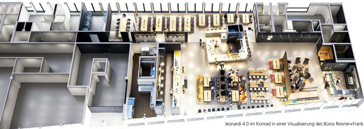
leonardi 4.0 im Konrad in einer Visualisierung des Büros Reisner+Frank.