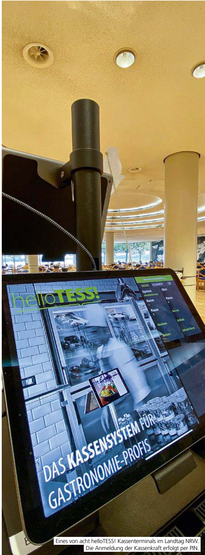
Eines von acht helloTESS! Kassenterminals im Landtag NRW. Die Anmeldung der Kassenkraft erfolgt per PIN.