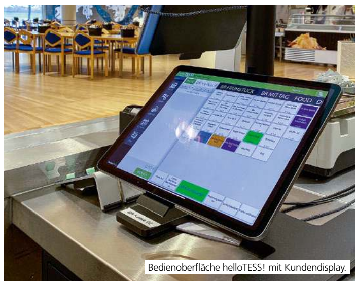
Bedienoberfläche helloTESS! mit Kundendisplay.

kulinarisch verwöhnt. Das Geheimnis, dass alles reibungslos läuft? Bestes Projektmanagement! "