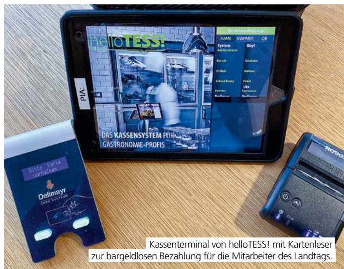
Kassenterminal von helloTESS! mit Kartenleser zur bargeldlosen Bezahlung für die Mitarbeiter des Landtags.