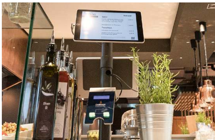
Automatisierter Bezahlvorgang mit Qualitätssicherung: Speisenerkennung via Kamera, selbständiges Bezahlen des Gastes. Die Qualitätskontrolle der Teller ist inbegriffen.

Ausgangspunkt für die gastronomische Konzeption war die Überlegung, mit dem kulinarischen Angebot den Veränderungen auf der